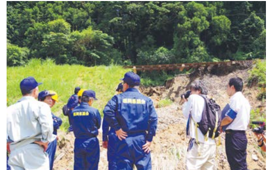
平成筑豊鉄道の被災現場の視察