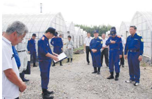
久留米市北野町農業用ハウスの視察