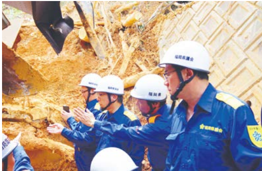
北九州市門司区の災害現場の視察

昨年の九州北部豪雨災害からちょうど1年たった時期に、また大きな災害が発生しました。県議会では、引きつづき委員会活動や会派の災害対策本部等を通して、県執行部と一体となって被災者の生活支援や公共土木施設の復旧等を推進し、被災地の一日も早い復旧・復興に向けて取り組んでまいります。