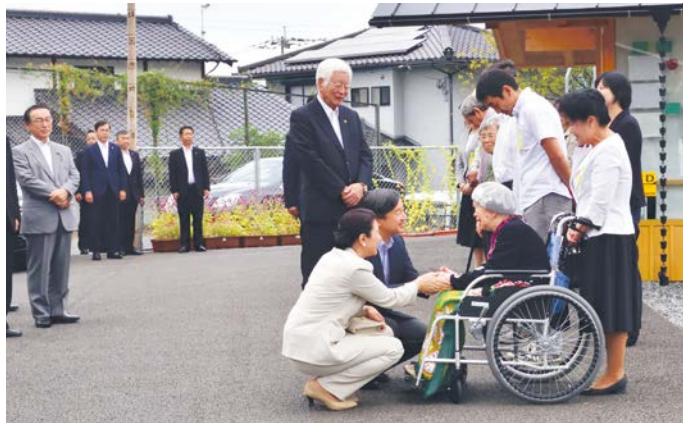
ご視察の様子(応急仮設住宅林田団地)

25日は、第4回世界社会科学フォーラム開会式に御臨席になる前に、新宮町にある医療型障がい児入所施設である県立粕屋新光園を御訪問になり、児童が歩行訓練等機能訓練を行う様子を御覧になりました。両殿下は、子どもたちの目線まで腰を落とし、励ましのお言葉をかけられるとともに、訓練内容について熱心に職員にお尋ねにされていました。