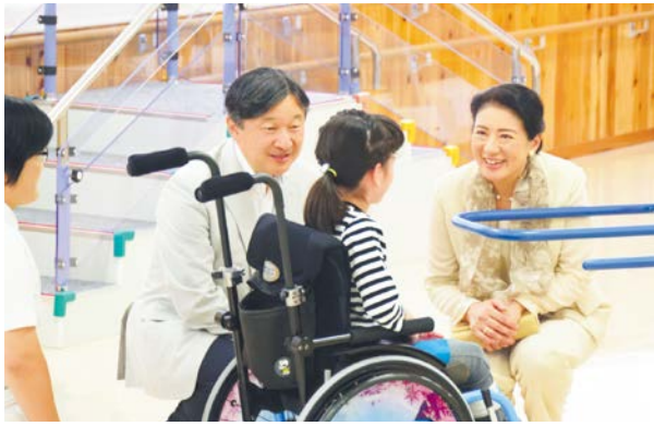
ご視察の様子(柏屋新光園)

9月25日、26日の2日間、皇太子・皇太子妃両殿下は、第4回世界社会科学フォーラム開会式御臨席及び平成29年7月九州北部豪雨災害復興状況等御視察のため福岡県をご訪問になり、井上順吾議長は小川洋知事とともに両殿下に随従しました。