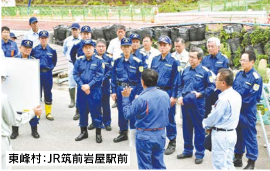
東峰村:JR筑前岩屋駅前

近年は、大規模災害がいつどこで発生するか予測できない状況にあり、今年6月末からの豪雨でも鹿児島をはじめ九州南部で大きな災害が発生しました。