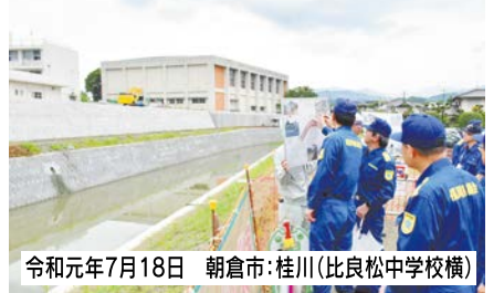
令和元年7月18日 朝倉市:桂川(比良松中学校横)